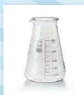
コニカルビーカー