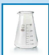
コニカルビーカー