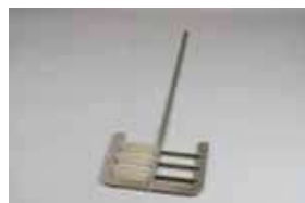
●例) 特型アンカーパドル翼

ヘリカルリボン翼やアンカー翼等、ご希望の攪拌翼を製作します。お気軽にご相談下さい。 ●テフロンコーティングも可能です