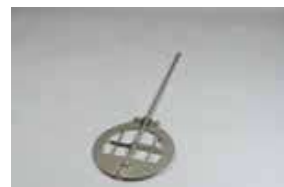
●例) 特型セパラブルフラスコ用折量翼